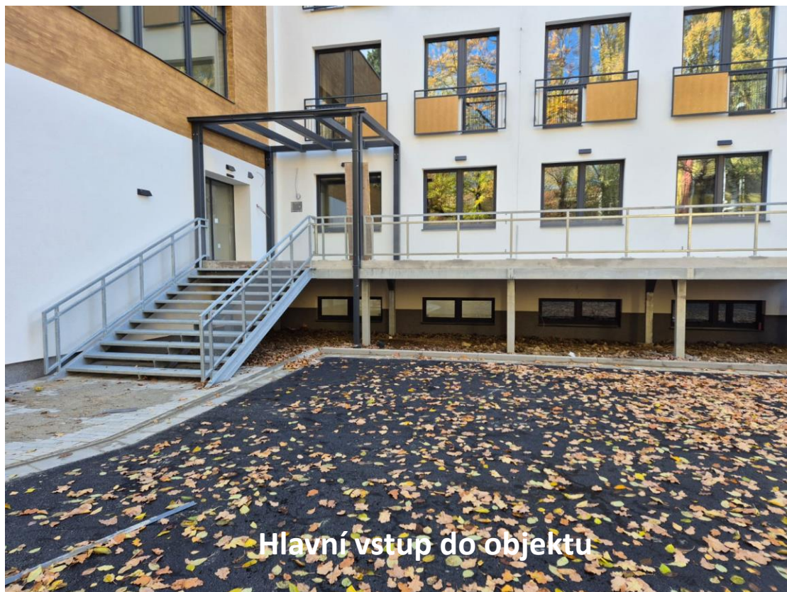
Hlavní vstup do objektu