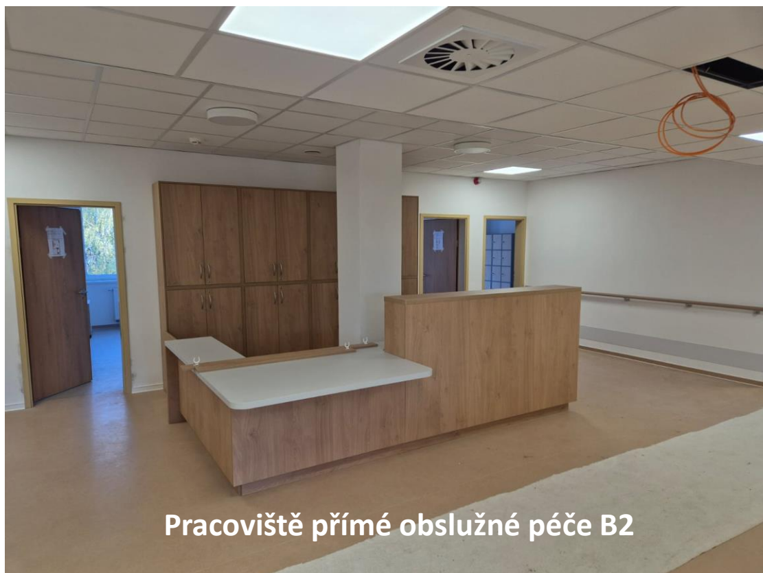
Pracoviště přímé obslužné péče B2