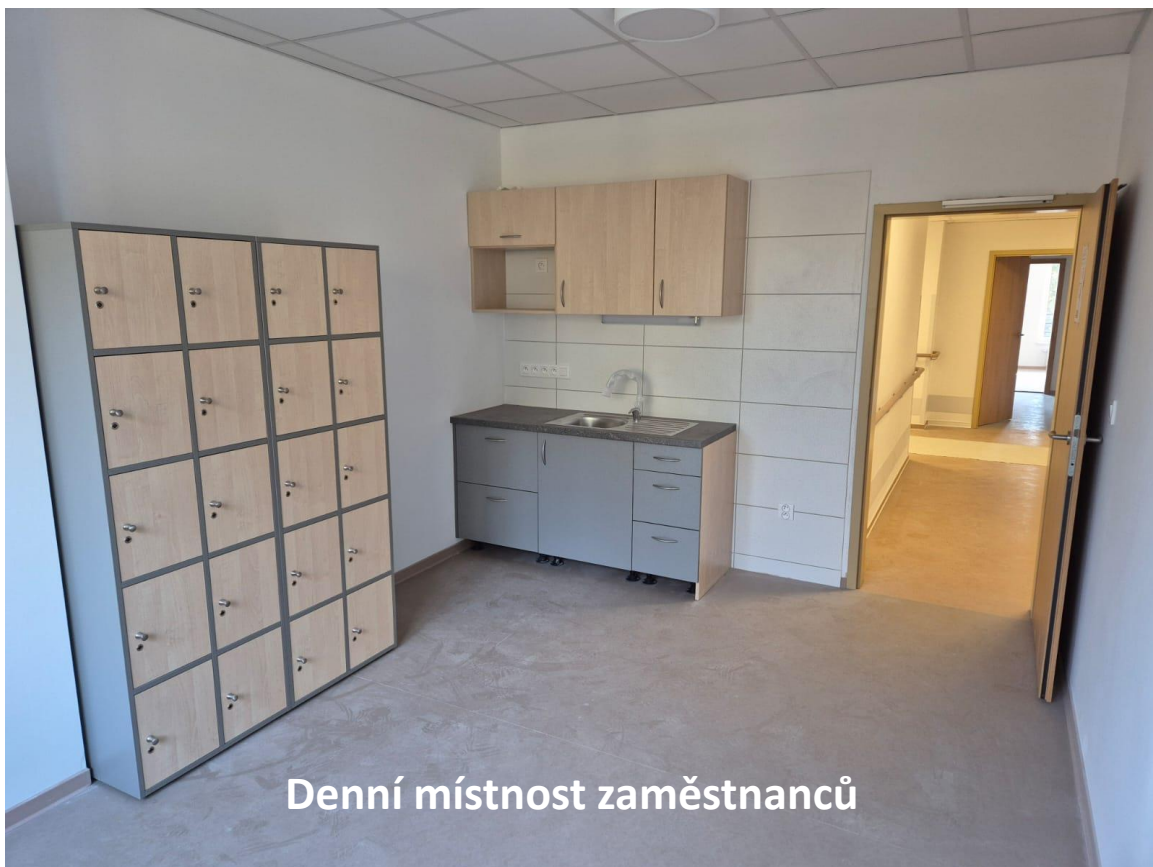
Denní místnost zaměstnanců