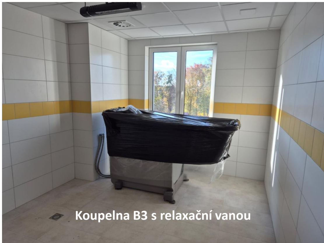
Koupelna B3 s relaxační vanou