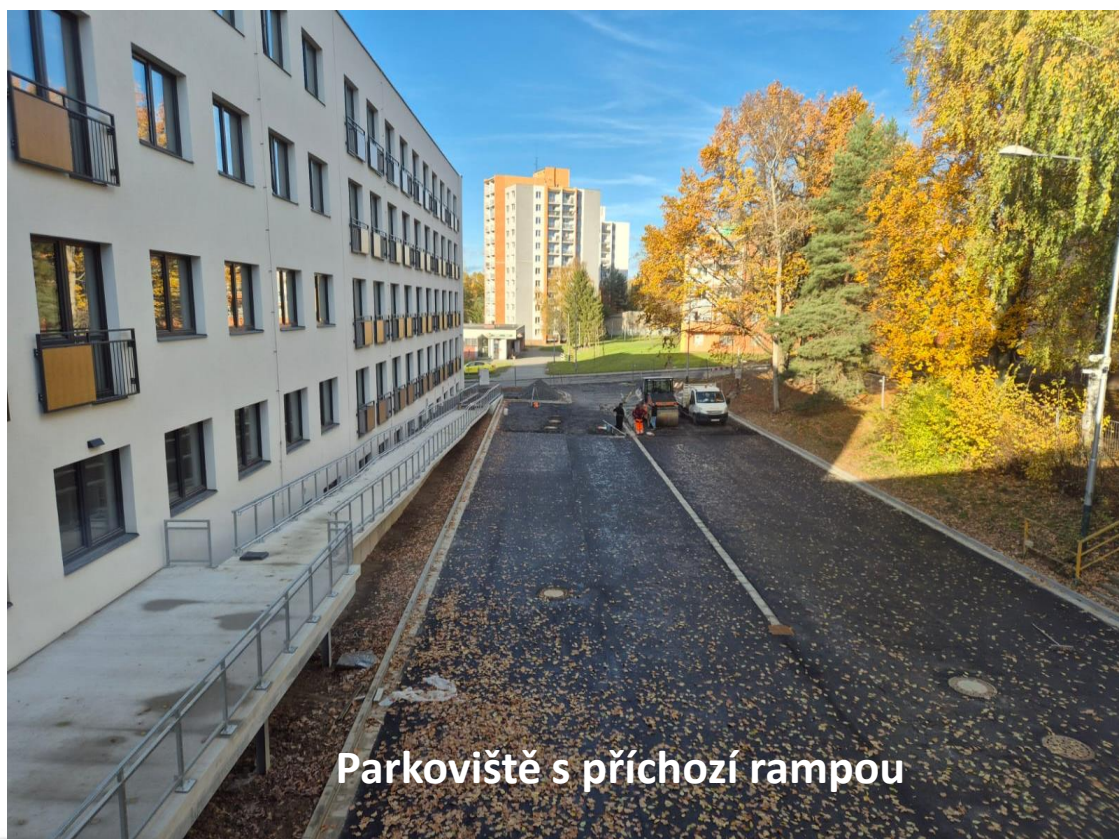
Parkoviště s příchozí rampou